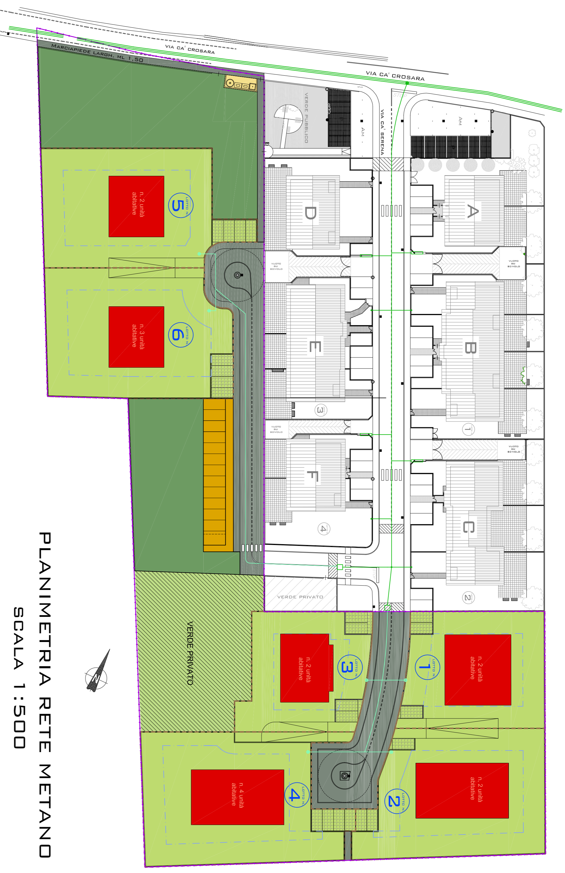
PLANIMETRIA RETE METANO SCALA 1:500